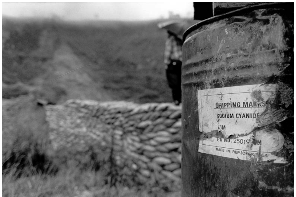
Zyanid: Hochgiftige Chemikalie gefährdet Menschen in Bergbaugebieten.

Der internationale Finanzmarkt ist sehr undurchsichtig und globale Finanzflüsse schwer zurückzufolgern. Finanziers von Projekten sind häufig Konsortien, um politische Risiken oder Risiken von Preisverlusten